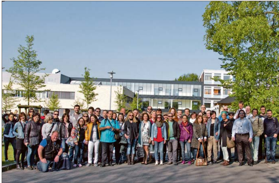
Els docents i tècnics que participaren a la visita a Alemanya. GOVERN

L'estada formativa va ser finançada íntegrament amb fons