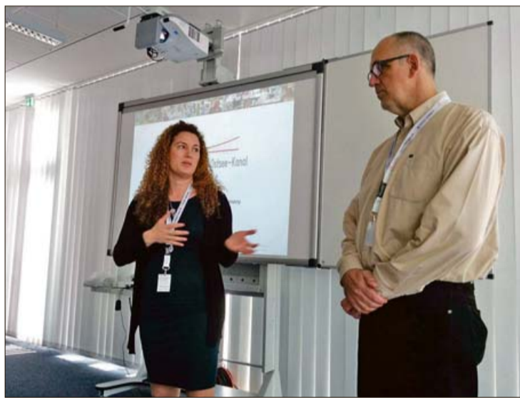
Varen conèixer com funciona i s'organitza la Formació Professional.

europèus del programa Erasmus+ del projecte EuroFP Balears de la Direcció General de Formació Professional i Formació del Professorat i dels projectes Erasmus+ de l'IES Francesc de Borja Moll, IES Politècnic i IES Josep Maria Quadrado.